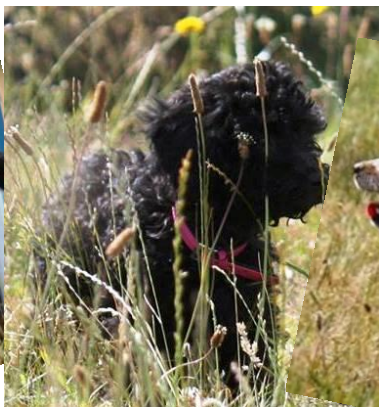
Tulle i et sjældent stille øjeblik.