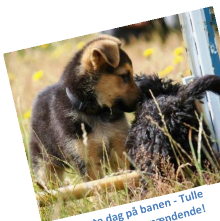
Rex's første dag på banen - Tulle synes han er meget spændende!