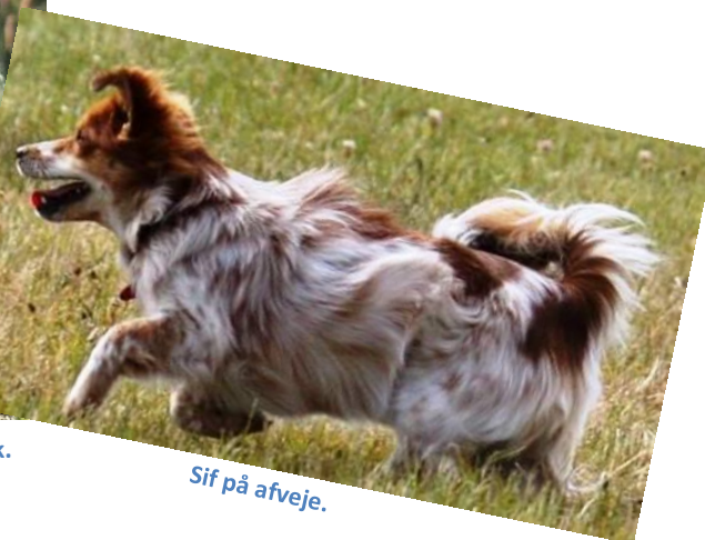
Sif på afveje.

Januars hvalpehold stillede op til kørekort, og alle kom igennem uden problemer. Mens de tobenede mennesker kæmpede med nerver, havde de firbenede til gengæld is i maven og en vis humoristisk sans (se billederne på facebook), og aprils hvalpehold skal også nok igennem prøven med samme bravur, når den tid kommer. Juni har set opstart af endnu et hvalpehold - små hunde alle med store personligheder, charme og masser af pels. Lige her på det sidste har vi også budt velkommen til Rex (schæfer) og Chilli (labrador) på holdet. Der bliver så en ønskelig blanding af store og små hunde, der lærer at omgås hinanden fornuftigt. Ventelisten er derved afviklet – alle hundeførere, der vil og kunne, er kommet i gang med træning på et hold.