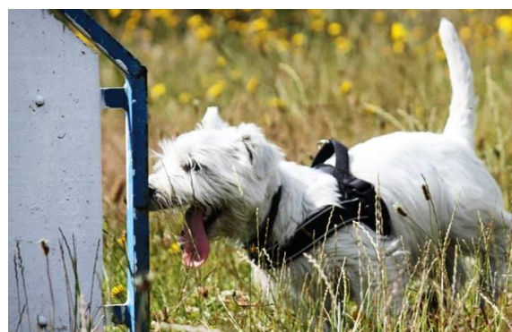
Otto samler kræfter til spring